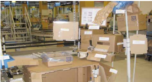
Ideen umsetzen, Konzepte erstellen und im Maßstab 1:1 modellieren

Perfekte Lösungen sind eine Synthese zwischen Wünschen und Machbarkeiten. Um DIE Lösung zu finden, müssen wir Ihre Abläufe, Pflichtenforderungen und Wünsche kennen. Gemeinsam mit Ihnen durchdenken und erarbeiten ein Projektleiter und weitere am Projekt beteiligte Mitarbeiter mögliche Lösungen. So gleichen wir den skizzierten Aufgabenkatalog frühzeitig mit den Machbarkeiten ab und bringen weitere Lösungsansätze aus unserem umfangreichen Erfahrungsschatz in das Projekt ein.